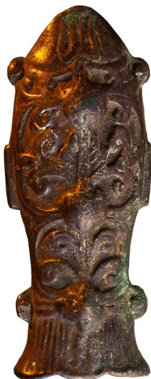
Рис. 2. Фигурка в виде сдвоенных рыб (по: Арсланова 2013б : фото на с. 230) Fig. 2. Figurine in the form of paired fish (according to: Arslanova 2013b : fig. on p. 230)

3. На левом крыле тазовых костей лежали бронзовое зеркало и 180 различных бусин из стекла и камня ( Арсланова 1998 : 100, рис. 2, 1–11).