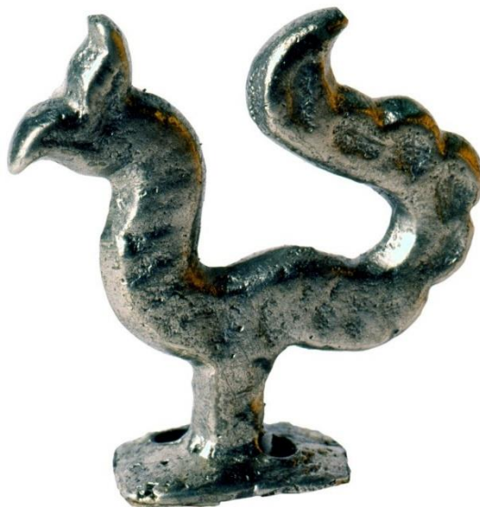
Рис. 1. Навершие головного убора (по: Арсланова 2013б : рис. на с. 318) Fig. 1. The top of the headdress (according to: Arslanova 2013b : fig. on p. 318)

10. В области темени найдено навершие в виде птицы, серебряное (рис. 1). Левее лежала бронзовая бляшка в виде стилизованных птичьих крыльев. Вокруг головы найдено несколько стеклянных бусин ( Археологические памятники... 1987: 206–208, рис. 102, 10–22).