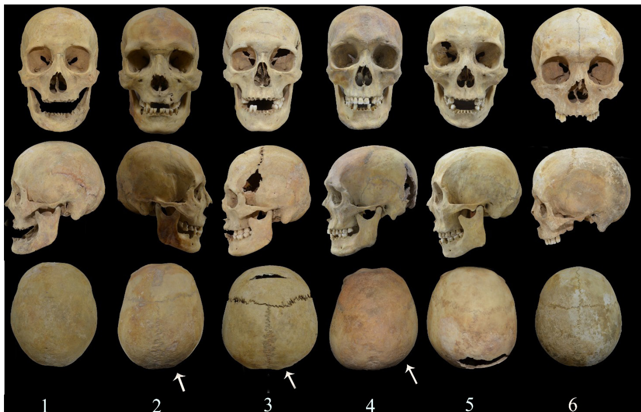
Рис. 3. Черепа из памятника Самсы (стрелкой указаны деформации «бешикового» типа):

бугорок tamī , протостилид, межкорневой затек эмали вторых моляров (верхние и нижние). Из одонтоглифических признаков первая борозда эоконуса первого верхнего моляра представляется вариантом 1eo (2), на первом нижнем моляре вариант II борозды метаконида впадает вторую фиссуру 2med (II). По таксономическим признакам одонтологии данный индивид относится к европеоидному антропологическому типу. Об этом свидетельствуют отсутствие дистального гребня тригонида, коленчатой складки метаконида, межкорневого затека эмали на вторых молярах и шестибугорковых форм нижних моляров, а также наличие варианта II второй борозды метаконида.