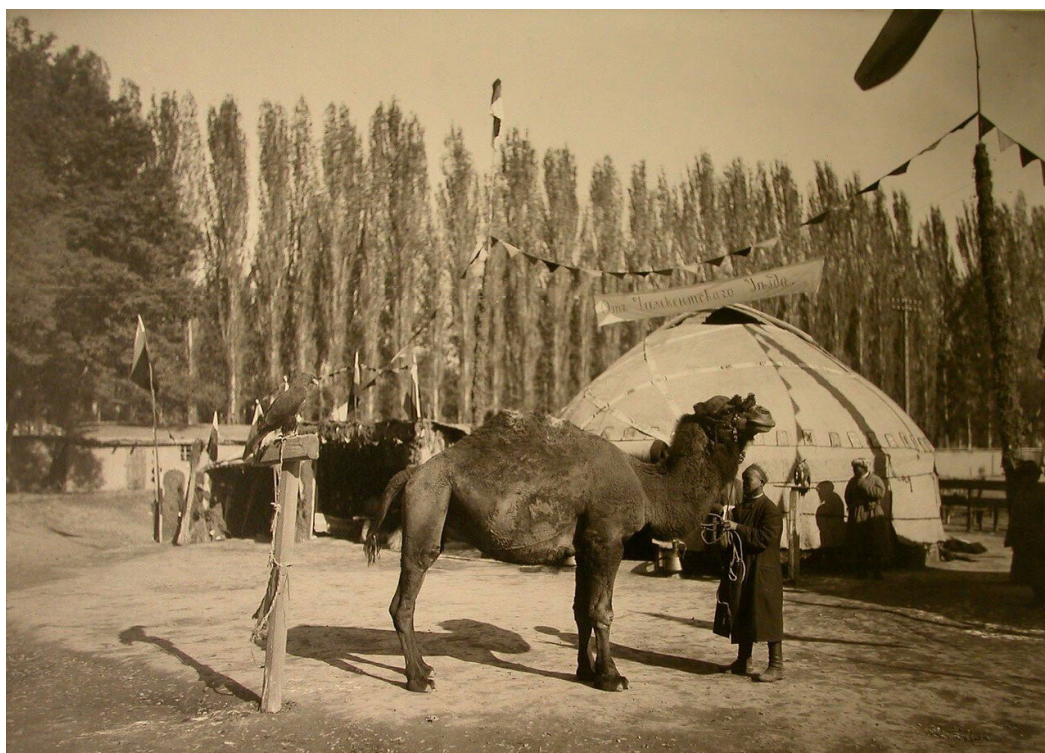
Рисунок 2 Один из экспонатов выставки – премированный верблюд. Ташкент, 1909.